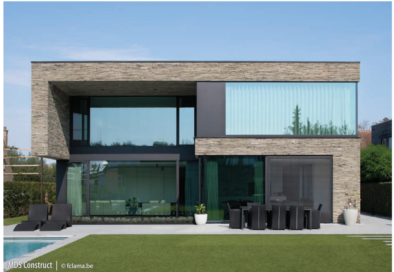
MDS Construct