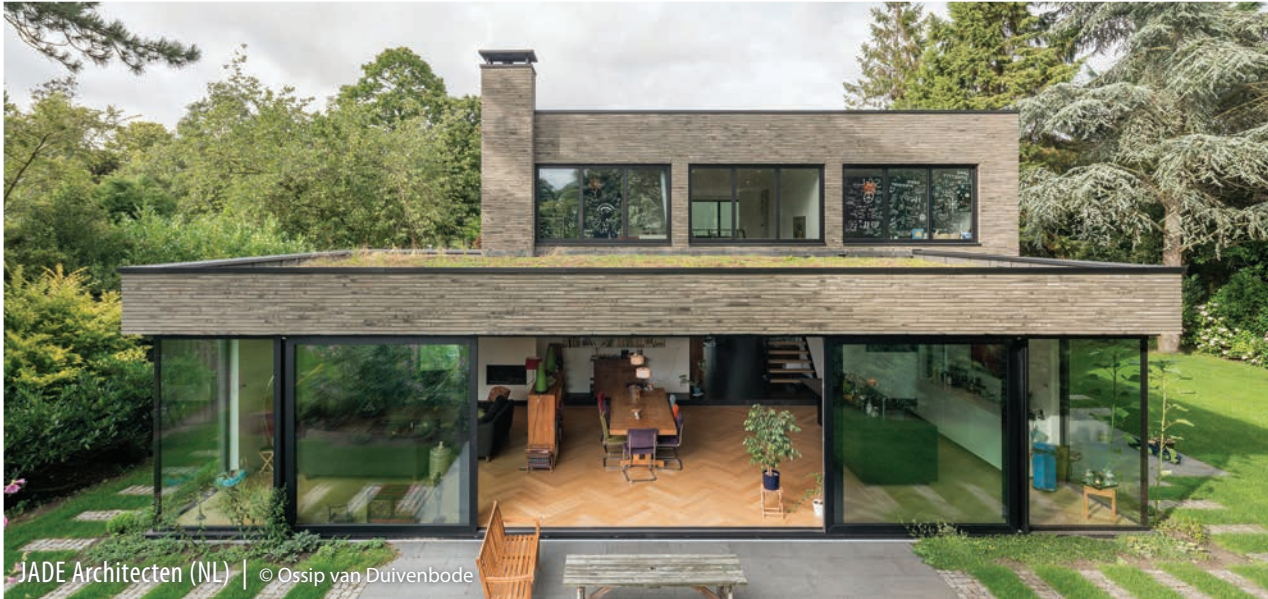
JADE Architecten (NL)