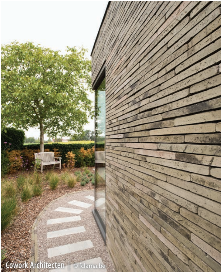
Cowork Architecten