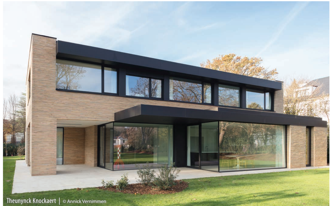
Theunynck Knockaert | © Annick Vernimmen