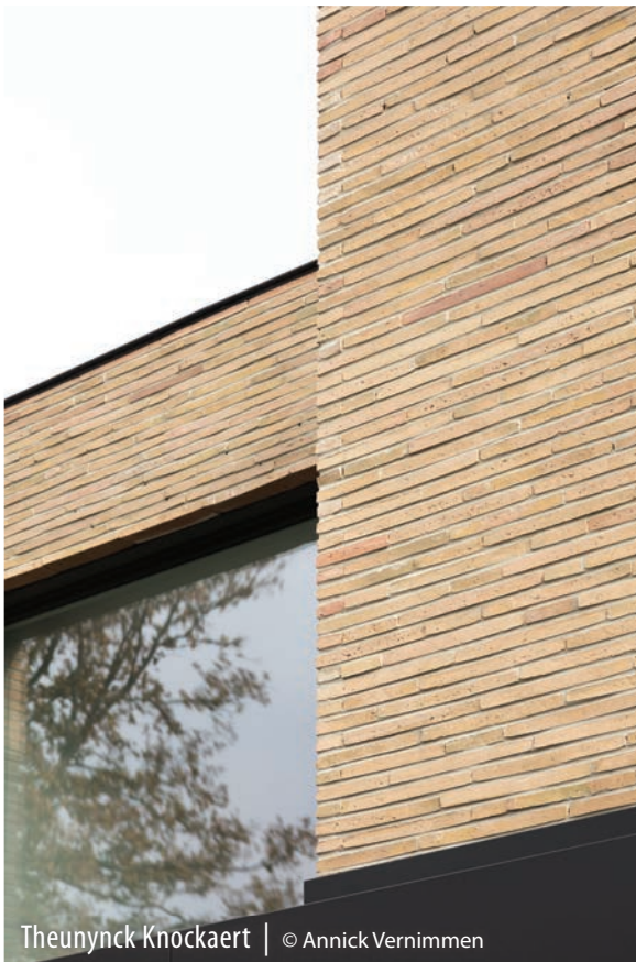
Theunynck Knockaert | © Annick Vernimmen