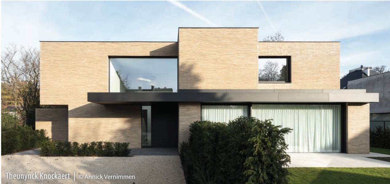
Theunynck Knockaert